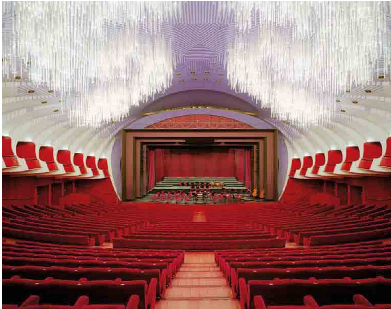
Leitmotiv in Dur: Der erste Eindruck beim Betreten des Konzertsaals oben ist eine aufbrandende Welle aus rotem Samt. Die Foyertreppen unten laufen unter der imposanten Betondecke am Saal entlang. Durch die Türen gelangt man direkt in die Logen.

Manche Frauen erinnern in manchen Situationen manche Männer an bestimmte Musikinstrumente. Der Surrealist Man Ray sah im nackten Rücken seiner Muse ein Cello, dem er ein fotografisches Denkmal setzte: „Le Violon d’Ingres“. Carlo Mollino schuf ein ganzes Opernhaus, dessen Grundriss der geschwungenen Silhouette einer Frau gleicht. Überhaupt widmete er sein ganzes Leben den Kurven, jedoch nicht nur den weiblichen. Mollino kurvte auf Skipisten, fotografierte den Linienverlauf im frischen Schnee und veröffentlichte gar ein Buch über eine neue Schwungtechnik. Er kurvte über Asphalt-pisten und konstruierte mehrere Rennwagen. Seine Möbel, die mittlerweile zu den teuersten Stücken auf dem Antiquitätenmarkt zählen, erweisen der verschlungenen Linie in endlosen Variationen ihre Reverenz. Er ließ junge, meist unbedeckte Damen posieren