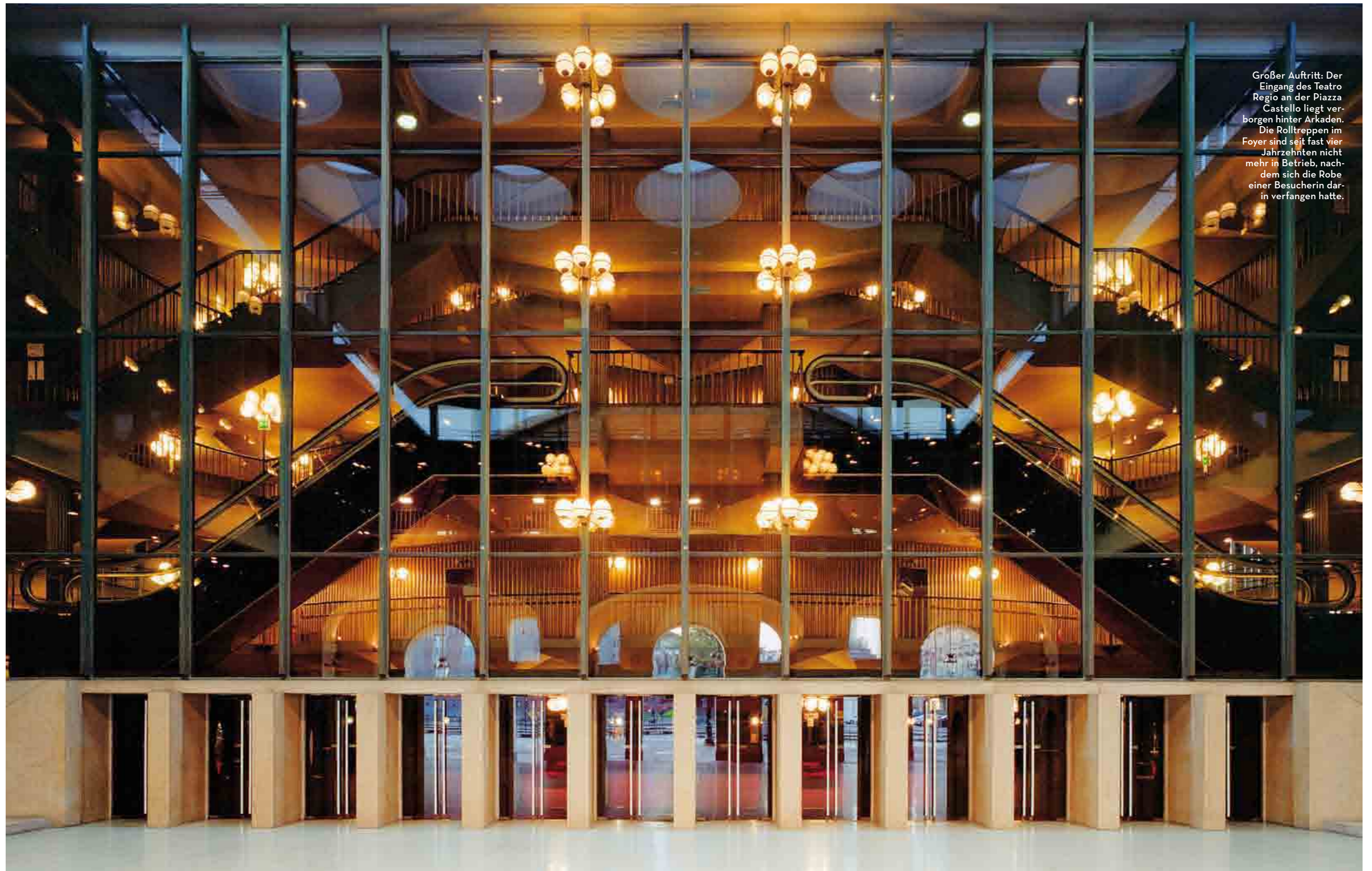
Großer Auftritt: Der Eingang des Teatro Regio an der Piazza Castello liegt verborgen hinter Arkaden. Die Rolltreppen im Foyer sind seit fast vier Jahrzehnten nicht mehr in Betrieb, nachdem sich die Robe einer Besucherin darin verfangen hatte.