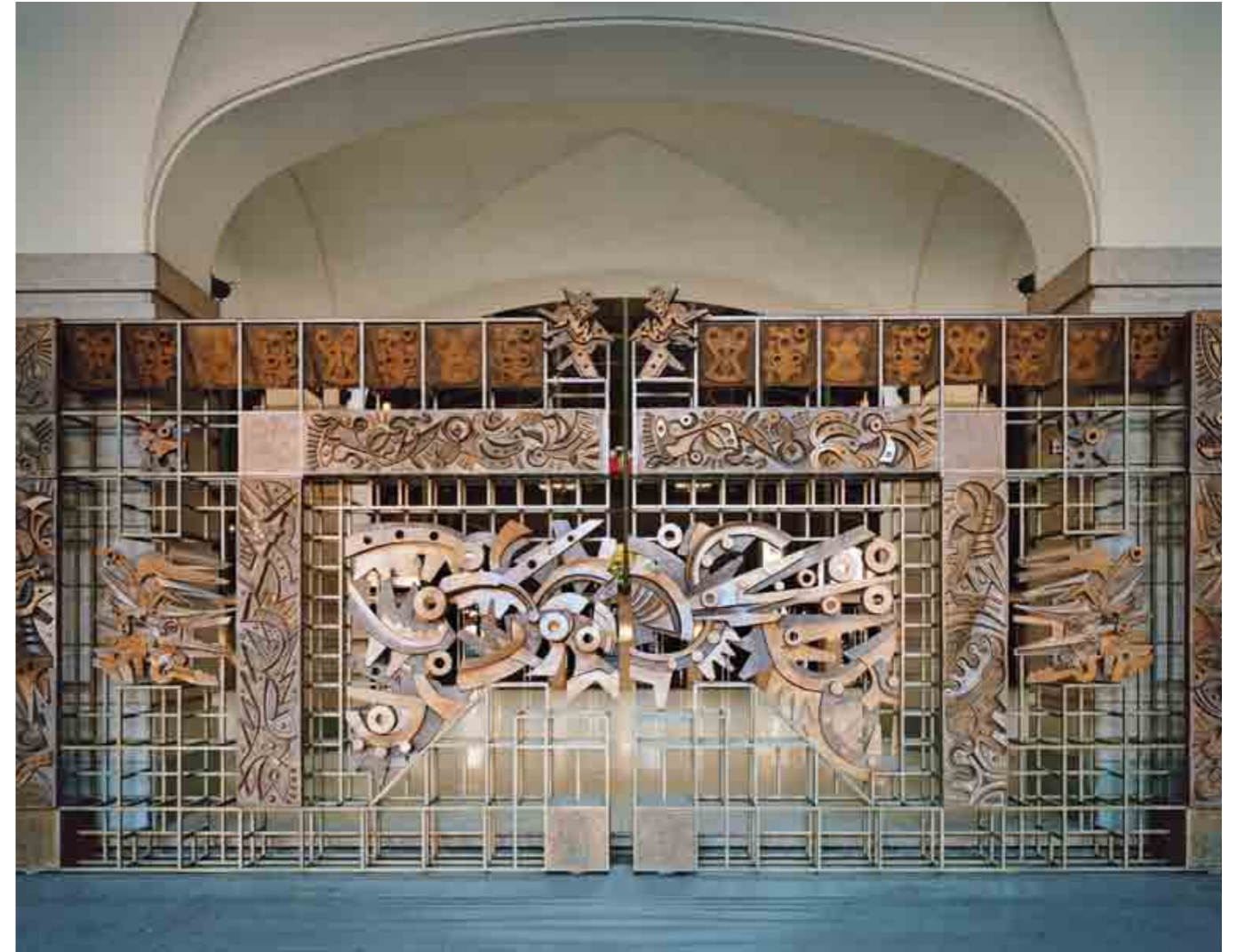
Eine der später notwendig gewordenen Baumaßnahmen ist das in den 1980ern hinzugefügte Tor oben, das Skateboarder abhalten soll. Das Pausenfoyer unten ist dagegen noch so erhalten, wie Mollino es eronnen hatte. Besuchsinfo im AD Plus ab S. 212.

Ausstattung her zu einem der führenden Häuser der Welt werden. Auf einem Foto, das bei der Präsentation der Entwürfe aufgenommen wurde, kann man Carlo Mollino mit seinem Co-Architekten Carlo Graffi sehen. Mollino hält ein Ei in der Hand. Dessen Form liegt dem Saal, der 1600 Zuschauern Platz bietet, zugrunde. Auch aus der Inspirationsquelle für die Architektur des gesamten Gebäudes machte er kein Geheimnis: Es ist die kurvige Silhouette einer jungen Frau. Diese nämlich warf er mit gewohnter Verve auf das Titelblatt einer zur Einweihung erschienenen Festschrift. Das Foyer dockt mit zwei glasverkleideten Brücken an dem Arkadengebäude zur Piazza Castello an, verjüngt sich zu einer Wespentaille und weitet sich dann wieder zum eiförmigen Zuschauerraum. Das Leitmotiv ist die Farbe Rot. Ursprünglich war unter dem weißen Eierschalenhimmel des großen Saals alles mit rotem Teppichboden verkleidet – Boden, Logen und