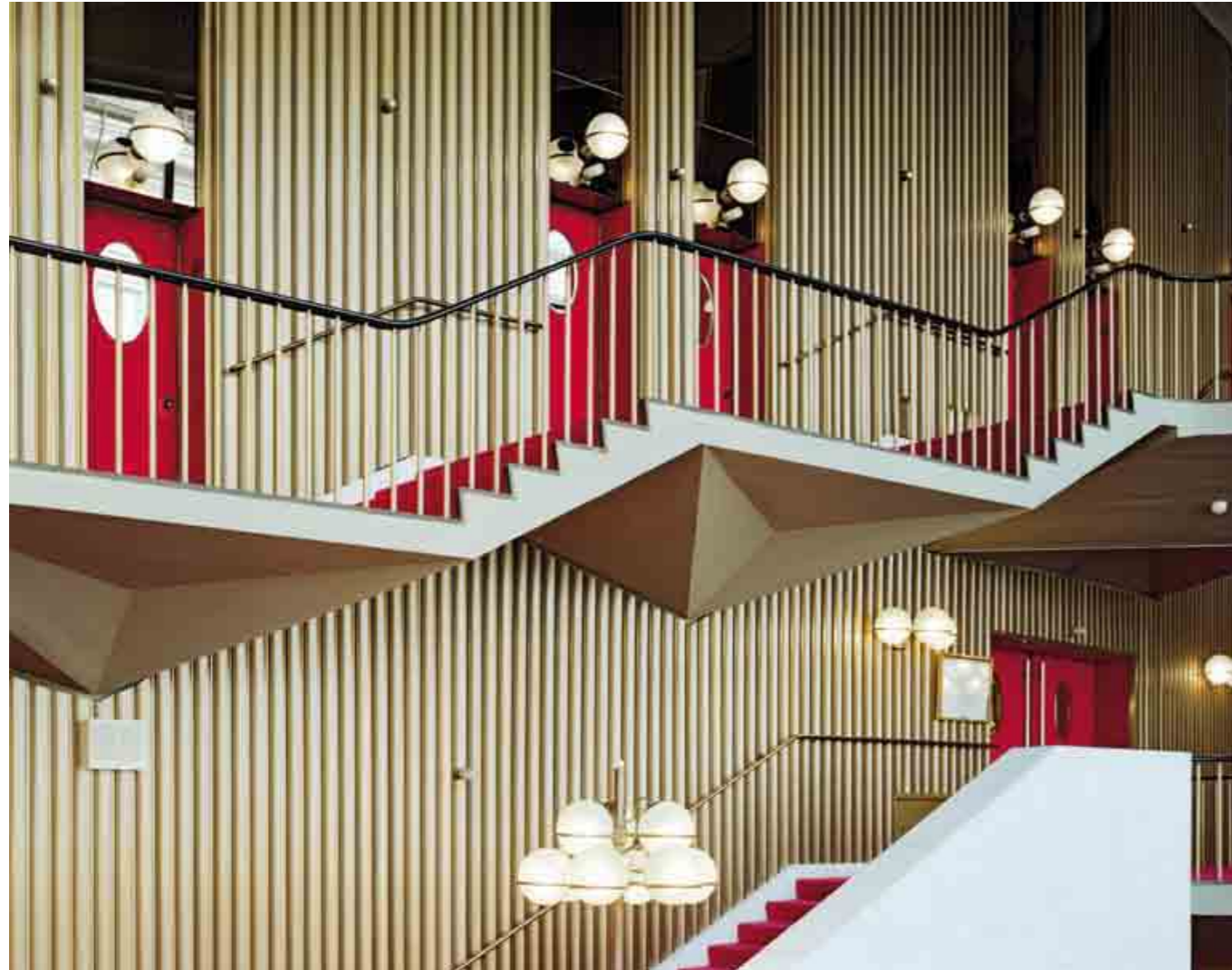
Acht Jahre arbeitete Mollino am Teatro Regio. 1970er-Elemente wie die goldfarbenen Außenwände des Konzertsaals aus Aluminium kombinierte er mit dem Riffelmuster antiker Säulen (oben). Die an Blütenstände erinnernden Kronleuchter unten entwarf er selbst.

Castello. Dabei war der Architekt hieran ausnahmsweise gänzlich unschuldig. Das Teatro Regio stand seit je in der zweiten Reihe hinter den Arkaden, die den Platz einfassen. Seine Geschichte reicht bis ins Jahr 1740 zurück. 1936 brannte es aus, der Zweite Weltkrieg besorgte weitere Zerstörungen. Erst 1965 ging der Direktauftrag seitens des Bürgermeisters an Mollino, nicht nur das in Ziegelsteinen ausgeführte Arkadengebäude wieder zu errichten, sondern auch einen dahinterliegenden Neubau für das Theater zu entwerfen, dessen Ensemble bis dahin in ein anderes Schauspielhaus ausweichen musste. Direktor des Teatro Regio – kein Sprech-, sondern ein reines Musiktheater – war damals Alberto Bruni Tedeschi, Vater der Schauspielerin Valeria Bruni Tedeschi und ihrer Halbschwester Carla Bruni. Seinem Wunsch gemäß sollte die Turiner Oper, deren künstlerischer Rang unbestritten war, auch architektonisch und von ihrer technischen